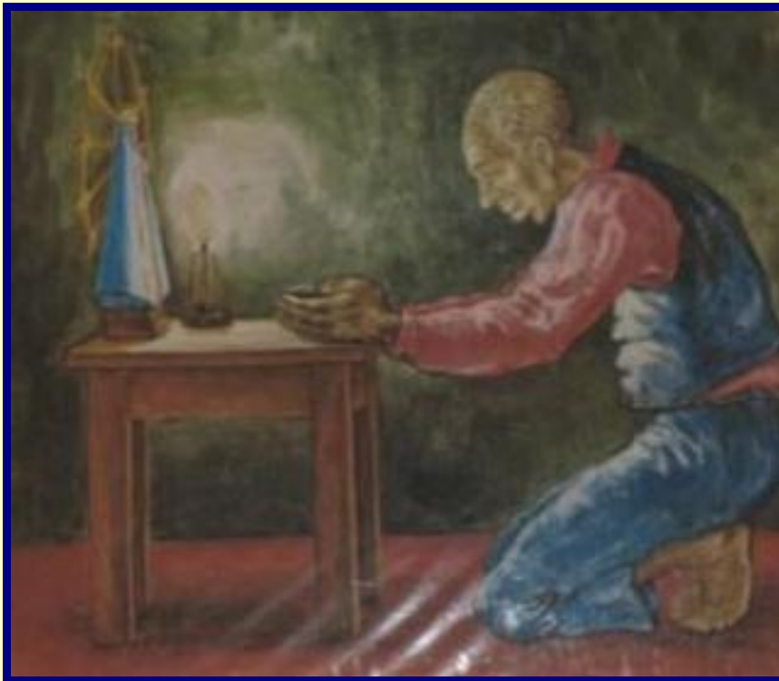
EL NEGRO MANUEL (detalle de un cuadro que esta en la Basílica)

empezaron a viajar al lugar, entonces don Rosendo construyó una pequeña capilla, entre los pajonales de la pampa, en este lugar permaneció la virgencita desde 1630 hasta 1674.