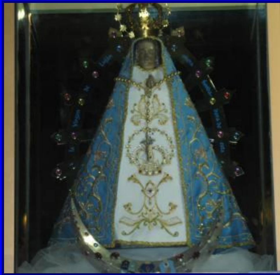
Imagen de la Virgen de Lujan, (original) que esta en la Basílica de Lujan, Argentina