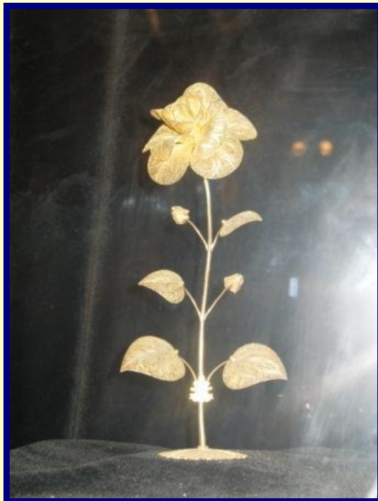
Rosa de Oro (aprox. 25 cm.)

En abril de 1982 (durante el conflicto por la Islas Malvinas entre Argentina e Inglaterra), el Santo Padre celebro Misa en Lujan, ante una impresionante cantidad de fieles, esa ocasión, el Santo Padre trajo de obsequio un flor de oro, que esta custodiada en la Cripta de la Basílica