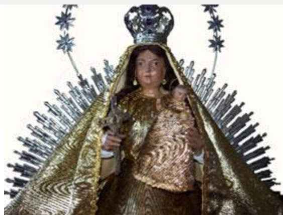
Imagen de Ntra. Sra. de La Caridad venerada en la iglesia de Sto. Tomás (Santiago de Cuba), desde la primera mitad del siglo XVIII.

Era 20 de mayo de 1951. La imagen de Ntra. Sra. de La Caridad, venerada en la antigua y santiaguera iglesia de Santo Tomás, fue llevada a El Cobre. Y allí La