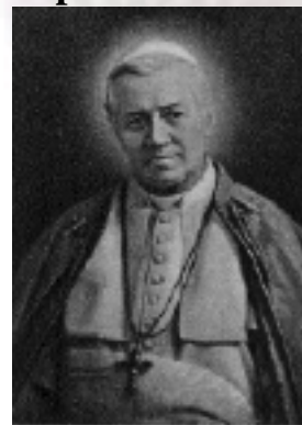
P.I.E. Pastor bono in populo ora pro nobis Domine!