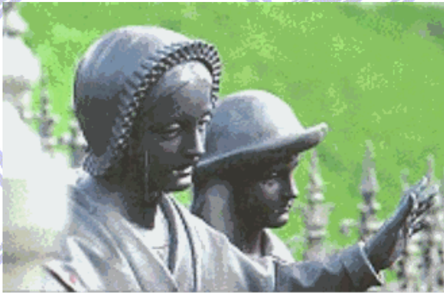
Escultura de Maximino e Melânia - Revista La Salette

El 19 de septiembre de 1851, Mons. Filiberto de Bruillard, Obispo de Grenoble, publica finalmente su "carta pastoral". He aquí el párrafo esencial: