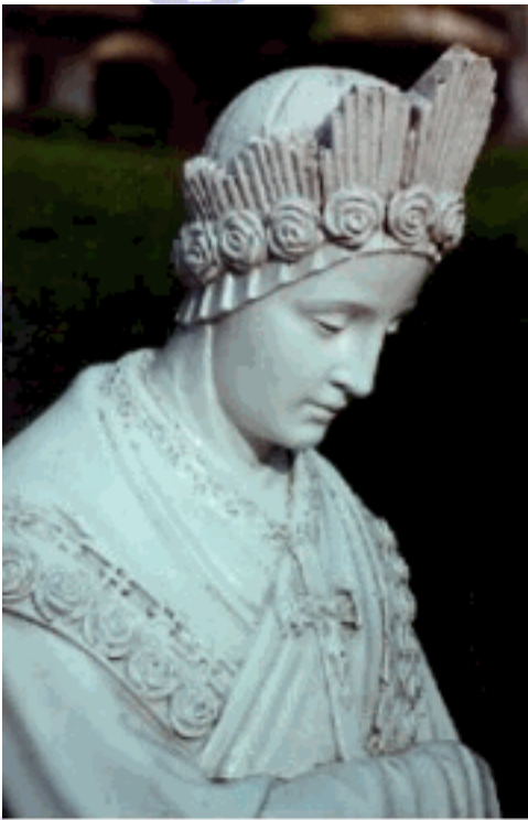
Imagem Jd.Seminário Salette Marcelino Ramos/ RS/ Brasil

<<Si mi pueblo no quiere someterse, me veo obligada a dejar caer el brazo de mi Hijo. Es tan fuerte y tan pesado que no puedo sostenerlo más.>>