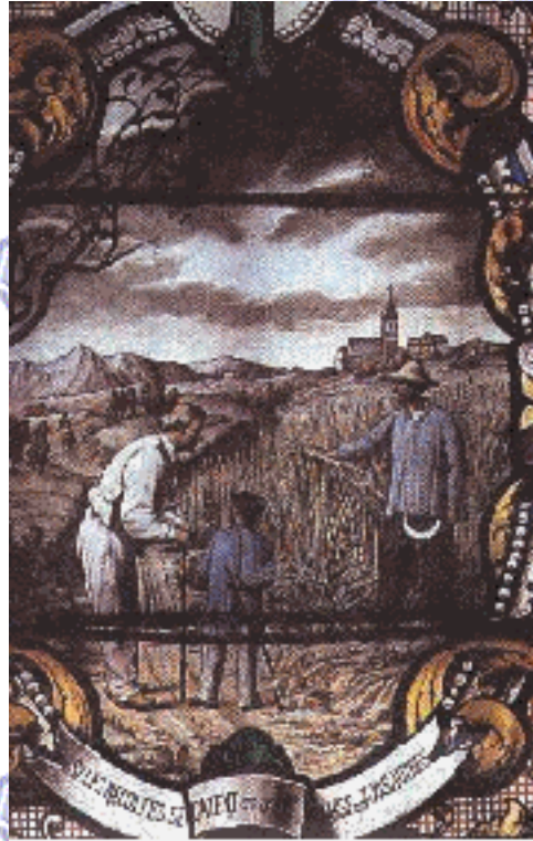
Imagem da Revista La Salette