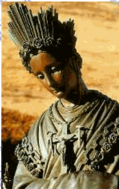
N.Sra.da Salette falando com Maximino e Melânia em prantos. Aparição - 1846

La Bella Señora se levanta. Ellos no han dicho una sola palabra. Ella les habla en francés: <<¡Acercaos, hijos míos, no tengáis miedo, estoy aquí para contaros una gran noticia!>> Entonces, descienden hacia ella. La miran, ella no cesa de llorar: "Parecía una madre a quien sus hijos habían pegado y se había refugiado en la montaña para llorar".