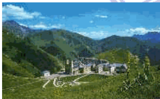
Vista geral do Santuário da Aparição Alpes Franceses - 1846

Está situado en plena montaña, a 1800 mts. de altitud en los Alpes franceses. De la atención del Santuario y su hospedería es responsable la Asociación de Peregrinos de La Salette por encargo de la diócesis de Grenoble. Los Misioneros y las Hermanas de Nuestra Señora de La Salette aseguran la animación y el funcionamiento, ayudados por capellanes, sacerdotes religiosos o diocesanos, religiosas, laicos asociados y por empleados asalariados y voluntarios. Con las Eucaristías, el rezo meditado del rosario, las vigiliyas y las procesiones, se articulan diversas propuestas: lecturas del evangelio, encuentros sobre un tema determinado, reuniones informales, encuentros con un capellán, sin olvidar la dimensión misionera y el servicio de las vocaciones.