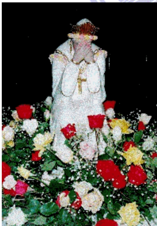
Imagem de N.Sra.da Salette em Lágrimas - Ig.N.Sra.da Salette Santana/ São Paulo/ Brasil

De repente, aunque la Bella Señora continúa hablando, sólo Maximino la oye, Melania la ve mover los labios, pero no oye nada. Unos instantes más tarde sucede lo contrario: Melania puede escucharla, mientras que Maximino no oye nada, y se entretiene haciendo girar su sombrero en una punta de su cayado mientras que con el otro extremo lanzaba pequeñas piedras. "¡Ninguna tocó los pies de la Bella Señora!", dirá algunos días más tarde. "Ella me contó algo diciéndome: No dirás esto ni esto. Después no entendí nada, y durante este tiempo, yo me entretenía."