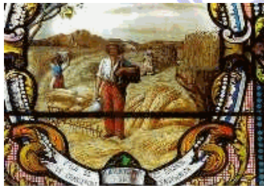
Vitral do Santuário da Aparição