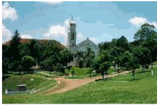
Santuário de N. Sra. da Salette Marcelino Ramos / RS / Brasil

"No muy bien, Señora", responden los dos niños.