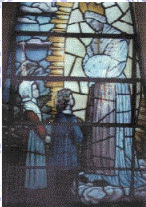
Vítrol da Igreja N.Sra.Salette Marcelino Ramos/ RS/ Brasil