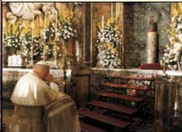
Pintura al óleo sobre madera policromada. Pedro Díaz de Oviedo. 1497. Catedral de Tarazona. -El Papa reza ante la «Pilarica»